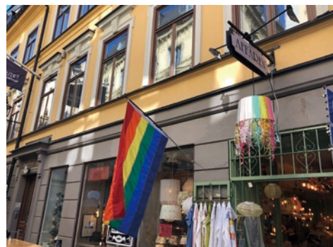
ストックホルム市内街中のレインボーフラッグ